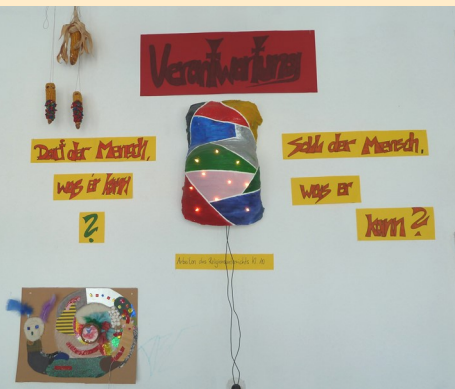
Arbeiten der Religions- schüler Klasse 10